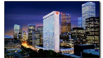
TORONTO: SHERATON CENTRE TORONTO

Mañana libre para compras de último momento. A la hora indicada traslado del hotel al aeropuerto Dorval y fin de los servicios.