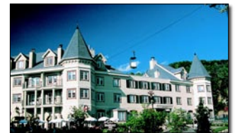
MONT TREMBLANT: MARRIOTT RESIDENCE INN