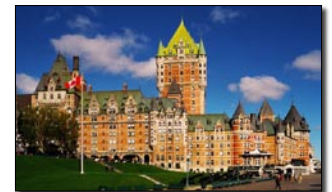
QUEBEC CITY: THE FAIRMONT LE CHATEAU FRONTENAC