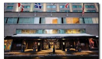
MONTREAL: THE FAIRMONT QUEEN ELIZABETH HOTEL