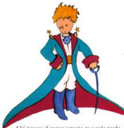
Aquí tienen el mejor retrato que más tarde logré hacer de él

Me puse en pie de un salto como herido por el rayo. Me froté los ojos. Miré a mi alrededor. Vi a un extraordinario muchachito que me miraba gravemente. Ahí tienen el mejor retrato que más tarde logré hacer de él, aunque mi dibujo, ciertamente es menos encantador que el modelo. Pero no es mía la culpa. Las personas mayores me desanimaron de mi carrera de pintor a la edad de seis años y no había aprendido a dibujar otra cosa que boas cerradas y boas abiertas.